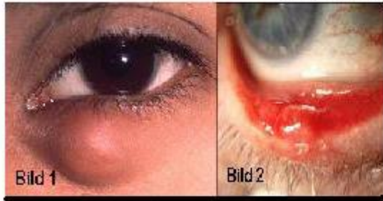
Bild 1: Ööm, rund, fast och fritt förskjutbar tumor i tarsalplattan

Bild 2: Kan spontanrupturera och ge upphov till granulom.