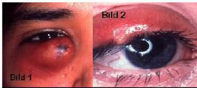
Bild 1: Intern - akut chalazion. Kan spontanperforera. Beh - se ovan.

Bild 2: Extern - vagel. Staph abscess i hårsäck alt Zeiss ell Molles körtel. Kan spontanperforera. Konservativ beh med antibiotika salva ev i komb med steroidsalva kan försökas